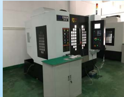
マシニングセンター