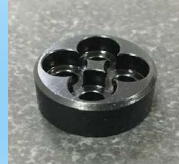
【材質】SS400 【表面处理】黒染め