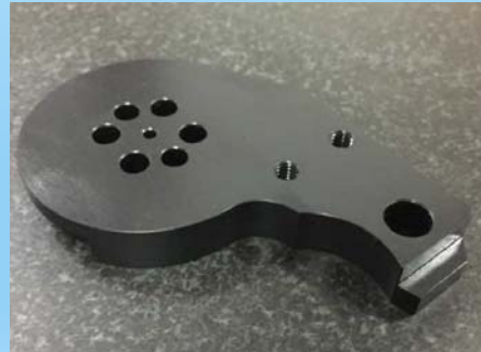
【材質】S45C 【表面处理】黒染め